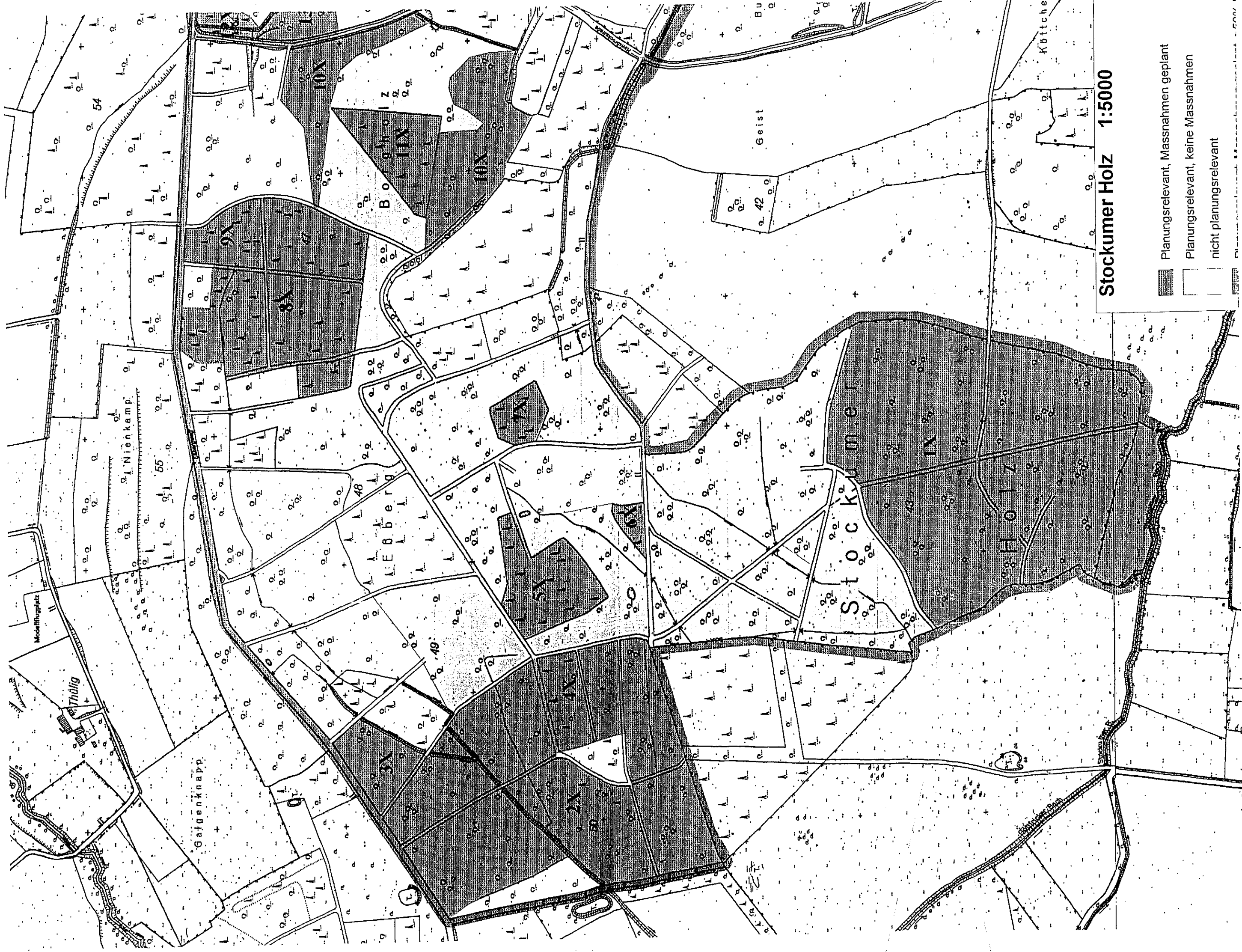
Stockumer Holz 1:5000