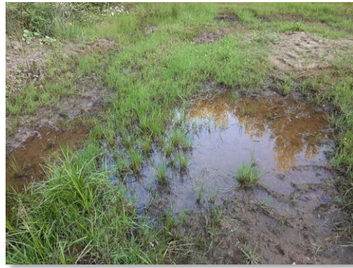
Abb.: links: Kleingewässer im Süden an Bermen-Abzweig, rechts im Norden am Ende der obersten Berme (kleine Terrasse) 2020