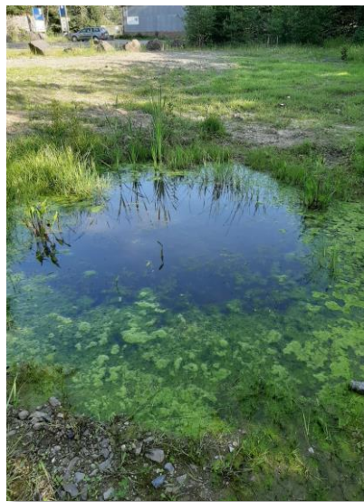
Abb.: Kleingewässer im Zufahrtbereich 2020