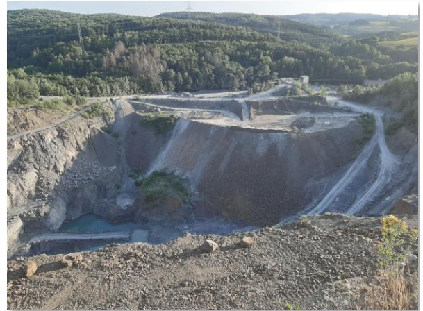
Abb.: Situation Abbaukessel (von links oben nach rechts unten): 2009, 2011, 2017 und 2020